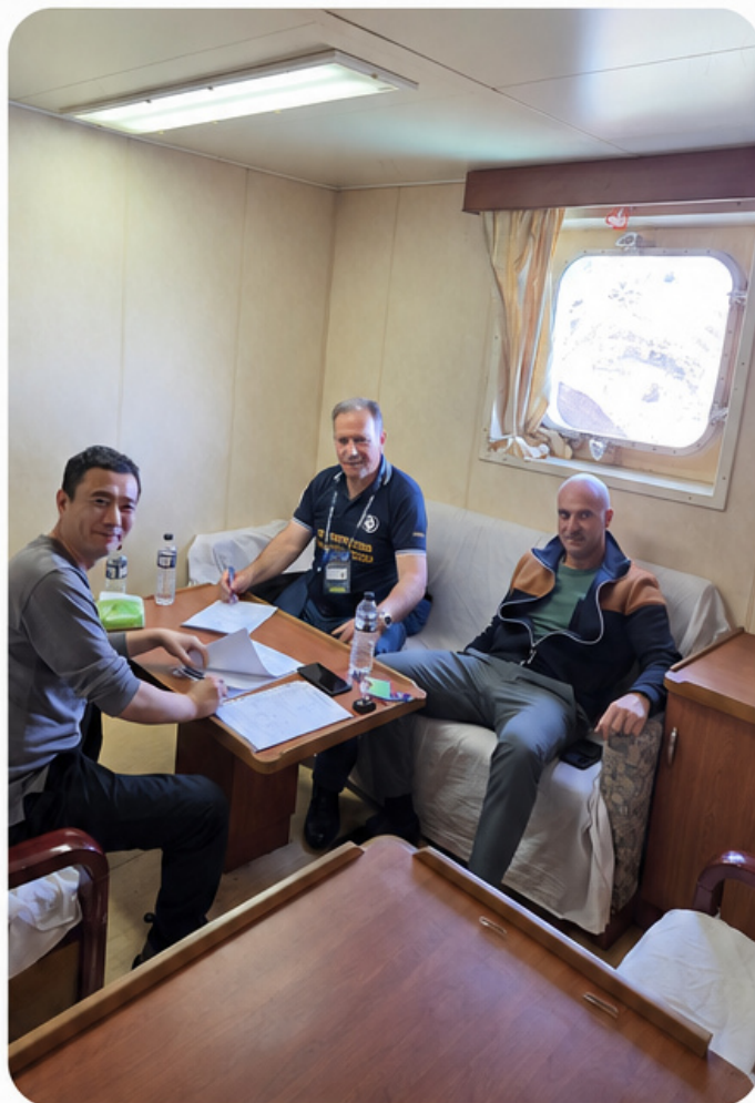
📷 Aktivnosti u okviru inspekcija i zaključenja ITF Special Agreement u Luci Bar i Port of Adria.

Za Sindikat to znači konkretno prisustvo na terenu, kontakt sa posadama i mogućnost da se problemi rješavaju odmah, kroz inspeksijski postupak, sindikalnu podršku i međunarodnu mrežu ITF-a.